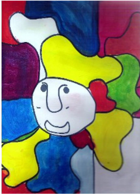
Art brut – Chissac 1960 18