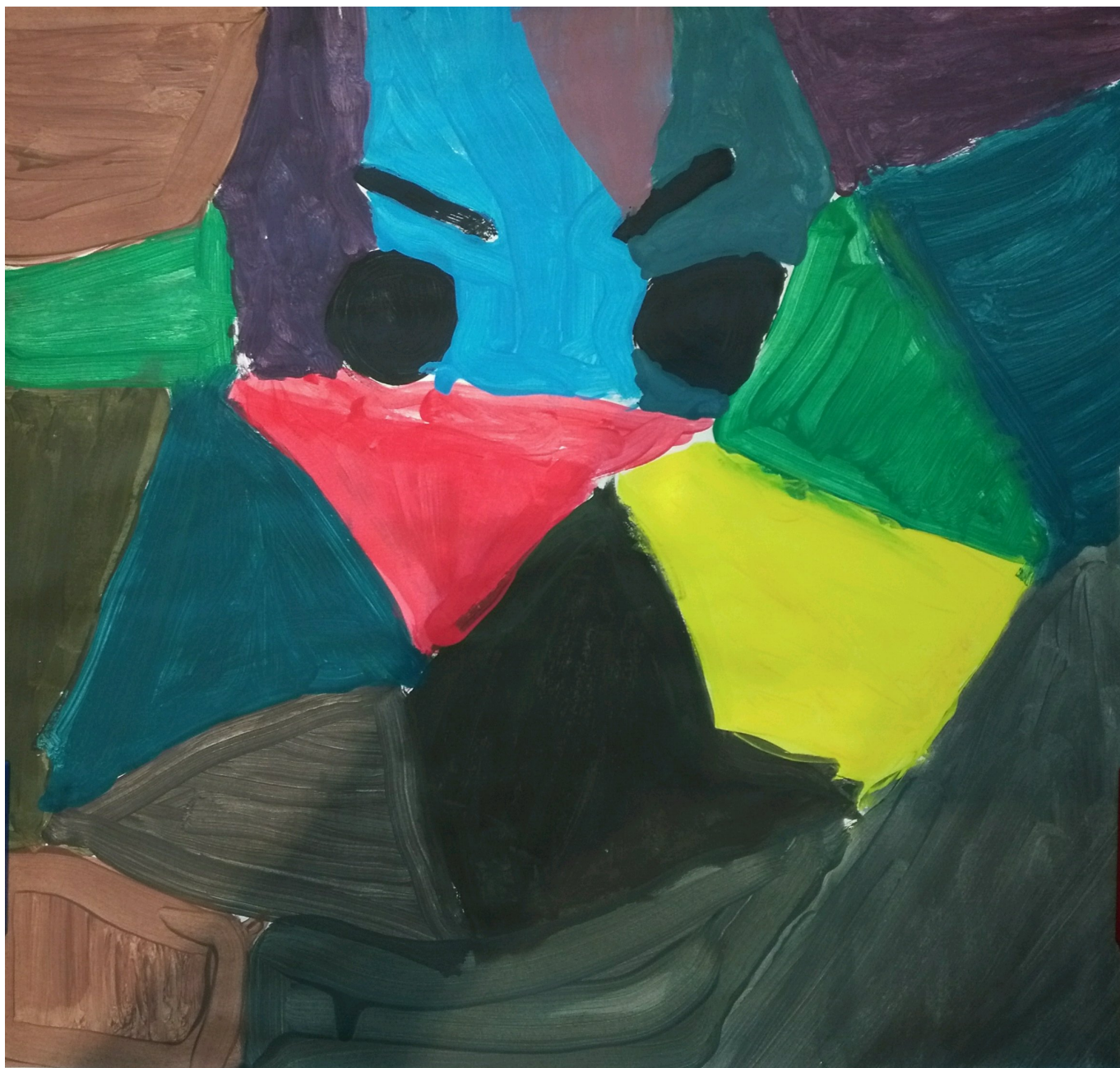
Voici la production libre d'un enfant de la classe.